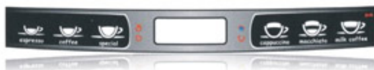
PROGRAMOVATELNÁ TLAČÍTKA VÝBĚRU PRODUKTŮ

Šest volně programovatelných tlačítek volby produktů usnadňují přípravu, ovšem ne výběr. Stačí stisknout tlačítko a už si vychutnáváme Ristretto, Espresso, kávu, kávu s mlékem, Latte macchiato, Cappuccino, horké mléko nebo čaj.